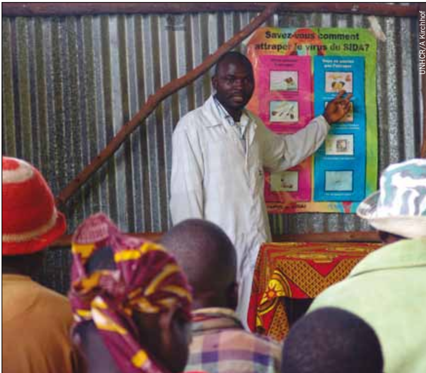
Séance d'information sur le VIH/sida pour les rapatriés venant de Tanzanie, au centre de transit de Mugano au Burundi.

que la guerre est, par définition, « guerre contre les femmes » et que le viol s'inscrit dans le cadre de la stratégie de la « terre brûlée », visant à semer la terreur et à détruire le tissu social et l'identité d'une communauté en poussant ses femmes à une vulnérabilité extrême. D'autres chercheurs décrivent une réalité plus complexe, dans laquelle les hommes et les femmes peuvent être tout aussi bien considérés comme victimes que comme auteurs de violences. Les analyses de l'évolution des relations hommes-femmes après les conflits suggèrent que lorsque le statut des femmes évolue en temps de guerre, il recule souvent après, ce qui met en lumière les racines profondes des valeurs sous-jacentes qui nient aux femmes le droit de participer aux décisions.