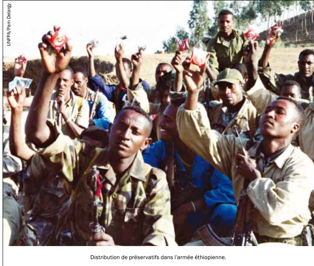
Distribution de préservatifs dans l'armée éthiopienne.